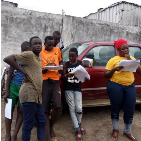
Répétition avec les jeunes du Centre Agape

Comme dans plusieurs pays à travers le monde, Douala a accueilli pour la première fois, Le 1 er Juin des écritures théâtrales jeunesse. Organisé par la Compagnie Les Racines avec l'onction d'ASSITEJ – France, l'événement s'est déroulé pendant trois journées : 31 mai, 1 er et 2 juin 2018 respectivement au Centre Agape, à la Maison des jeunes et de la culture (MJC) New-Bell et à l'Institut Français de Douala.