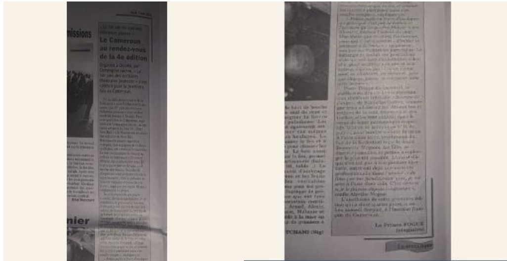
Article paru dans le quotidien national privé LE MESSAGER