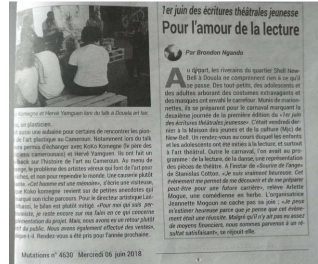
Article paru dans le quotidien national privé MUTATIONS