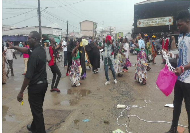
Caravane dans les rues de New-Bell