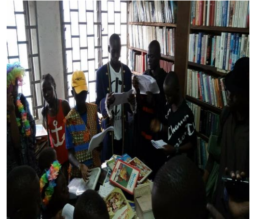
Séance de lecture à la MJC New-Bell